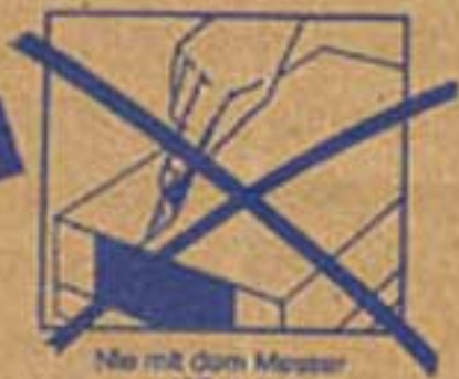
Nie mit dem Messer öffnen!