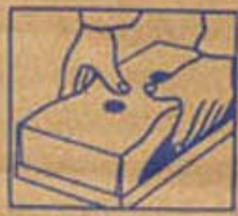
Deckel links und rechts eindrücken ...